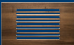
PLANCHE À PAIN 1/1 MARRON (BOIS) TAGLIERE PER IL PANE 1/1 MARRONE (LEGNO) TABLA DE CORTAR PARA PAN 1/1 MARRÓN (MADERAS)